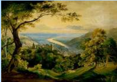
Heidelberg - Carl Rottmann, 1815

Que ce soit dans la vieille ville ou au château, l'histoire est présente partout à Heidelberg. Ayant comme université la plus ancienne d'Allemagne, qui fut fondée en 1386, Heidelberg a plus de 800 ans d'histoire. D'antan la ville compta de nombreux poètes comme Goethe, Eichendorf et Mark Twain ainsi que de nombreux artistes connus comme Turner, Fohr et Trübner qui se laissèrent inspirer par les paysages colorés de la ville. Heidelberg connu par ailleurs plusieurs grands compositeurs