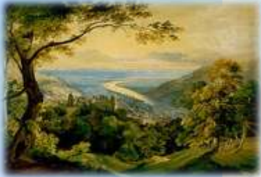
Heidelberg - Carl Rottmann, 1815

Seja a cidade histórica ou o castelo, a cada passo nos deparamos com a história. A cidade com a mais antiga universidade da Alemanha (fundada em 1386) olha para uma história de mais de 800 anos. Nesse tempo, a cidade atraiu poetas como Goethe, Eichendorff e Mark Twain, artistas conhecidos como Turner, Fohr e Trübner deixaram-se inspirar pelas suas impressões coloridas, e compositores como Brahms,