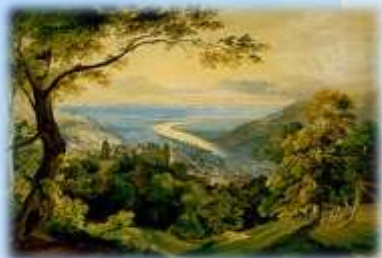
Heidelberg - Carl Rottmann, 1815

Где бы Вы не находились в Старом Городе Гейдельберга или в замке – здесь Вы встречаетесь с историей на каждом шагу. Город со старейшим университетом Германии (основанным в 1386 году) уносит Вас более чем на 800 лет назад. В то время он притягивал таких писателей как Гёте, Эйхендорф и Марк Твен, известные художники Турнер, Фор и Трюбнер получали вдохновение от незабываемых цветов и