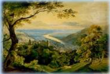
Heidelberg - Carl Rottmann, 1815

Seja a cidade histórica ou o castelo, a cada passo nos deparamos com a história. A cidade com a mais antiga universidade da Alemanha (fundada em 1386) olha para uma história de mais de 800 anos. Nesse tempo, a cidade atraiu poetas como Goethe, Eichendorff e Mark Twain, artistas conhecidos como Turner, Fohr e Trübner deixaram-se inspirar pelas suas impressões coloridas, e compositores como Brahms,